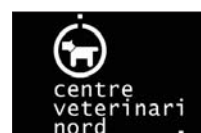
CENTRE VETERINARI NORD