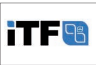
ITF (TECHNICAL FOODS)