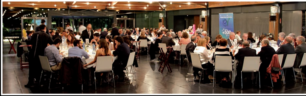
El sopar va reunir 120 persones en un restaurant que compta amb una estrella Michelin