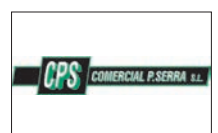
COMERCIAL PERE SERRA