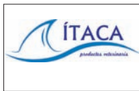
ITACA PRODUCTES VETERINARIS